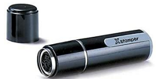
シャチハタ ネーム9